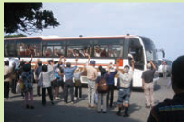
受入農家とのお別れ