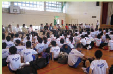
受入農家との対面