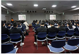
スタッフによる解説