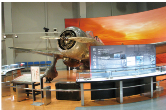
世界で唯一の「九七式戦闘機」