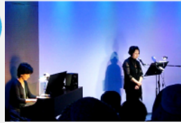
映画 + 朗読