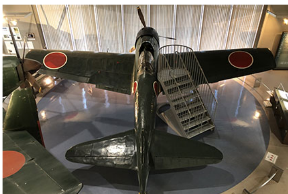
世界で唯一の「ゼロ戦32型」