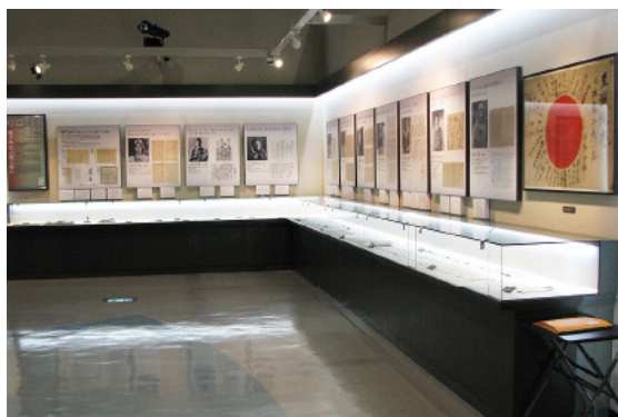
愛する家族への想いを伝える手紙や遺書