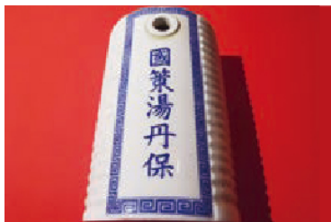
国策湯丹保(陶器製)

戦時下の市民が使用していた日用品や出征する兵士へ贈った品、戦地の兵士とその家族との間で交わされた手紙など当時の人々の暮らしぶりや考え方・心情を伝える資料を展示しわかりやすく紹介しています。また、長崎市から借り受けた原爆被災資料も展示しています。