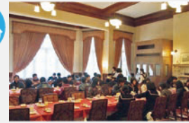
「レトロクーポン」を使って、お店を選んでお食事 旧大連航路上屋 (P29) でもお弁当を食べる事が出来ます!