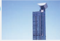
門司港レトロ展望室 海峡の地形と交通を学ぼう 103mの高さから海峡を見学