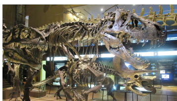
大迫力の恐竜たち

北九州市には西日本最大級の自然史・歴史博物館があります。地球の成り立ちや生命の歩みを学ぶ自然史ゾーンと、太古から現代までの暮らしの変遷をたどる歴史ゾーンで構成され、子どもたちの知的好奇心をくすぐる映像展開や参加型展示も充実しています。