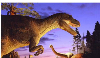
恐竜が吠える！動く！

100mに及ぶ「進化の大通り」には、時間軸に沿って大小多彩な恐竜たちが大集合。大人気のティラノサウルスや世界最大級の恐竜・翼竜の骨格標本は必見です。