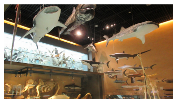
たくさんの生物を展示

約1億3000万年前、白亜紀の北九州地域を360度のジオラマで再現しています。恐竜たちのリアルな動きや鳴き声の中、タイムトリップ！