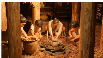
昔の人の生活を実感！