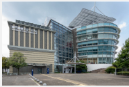
関門海峡ミュージアム 関門海峡の歴史と文化、自然を学ぼう