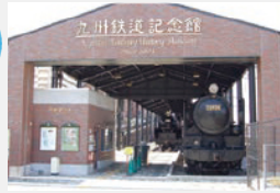
JR門司港駅、九州鉄道記念館 鉄道交通の歴史と役割を学ぼう