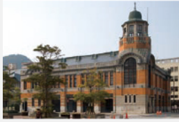
旧三井倶楽部、旧大阪商船、旧門司税関 近代日本の歴史と文化を学ぼう