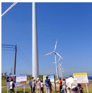
「SDGs未来都市」北九州市ならではの SDGs学習 SUSTAINABILITY

北九州市は、明治の八幡製鐵所から続くものづくりの街、公害を克服した環境未来都市、歴史と文化の薫る城下町、豊かな大自然など、さまざまな顔を持つまちです。その特徴を活かして、多様で特徴的な体験型・学習型の教育旅行プログラムを提供しています。新幹線駅、空港、フェリー港が揃い、とてもアクセスしやすい北九州市で、ここしかできない、充実した教育旅行をご提案します。