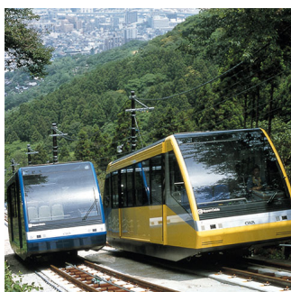
豊かな自然を通じ自然との共生を学ぶ 自然学習 NATURE