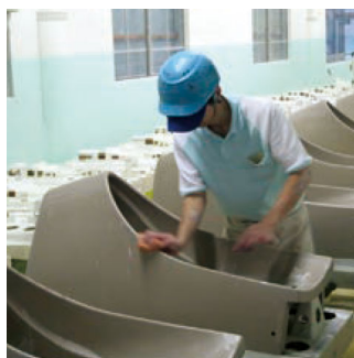
産業の現場を学ぼう 産業学習 INDUSTRY