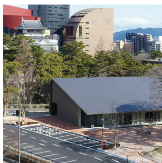
北九州市で平和の大切さを学ぼう 平和学習 PEACE