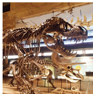
北九州市で自然史・歴史を学ぼう 自然史・歴史・文化学習 NATURAL HISTORY / HISTORY / CULTURE