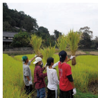
豊かな自然を活かした体験メニュー 農村学習 RURAL